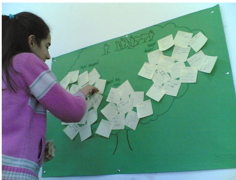
Lavori realizzati in classe

Nell'analisi si è avviata una sensibile riflessione su alcune parole chiave e sulle similitudini e diversità emerse tra quanto trasmesso e quanto percepito dagli studenti. L'attività è stata arricchita dalla visione di alcuni contributi attraverso cui si è discusso sulla notizia e sulla costruzione del video anche attraverso l'analisi delle differenze. L'obiettivo è stato quello di evidenziare la necessità di accedere alle fonti di informazione in modo critico e non passivo al fine di approfondire la conoscenza e costruirsi una propria visione del mondo. L'attenzione delle classi e gli interventi, di alcuni studenti in particolare, hanno posto le basi per usufruire in modo più consapevole delle informazioni, riprova la stessa capacità di interpretazione e valutazione esercitata successivamente nella visione di altri contributi video.