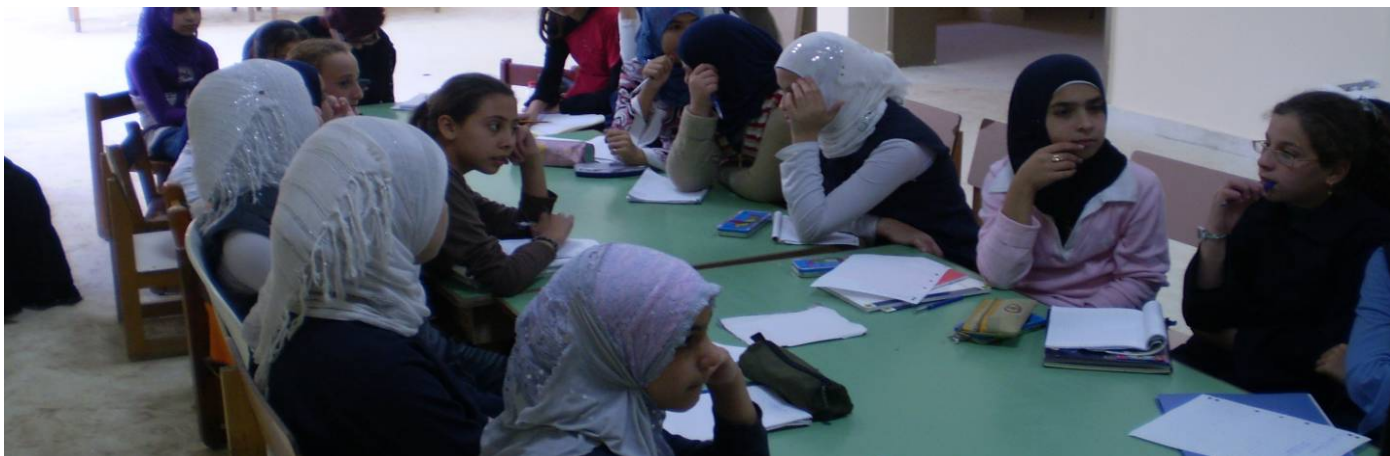
Classe di Nahr el Bared

Sento ancora nelle orecchie la voce di mia madre che urla per la morte di mio padre.