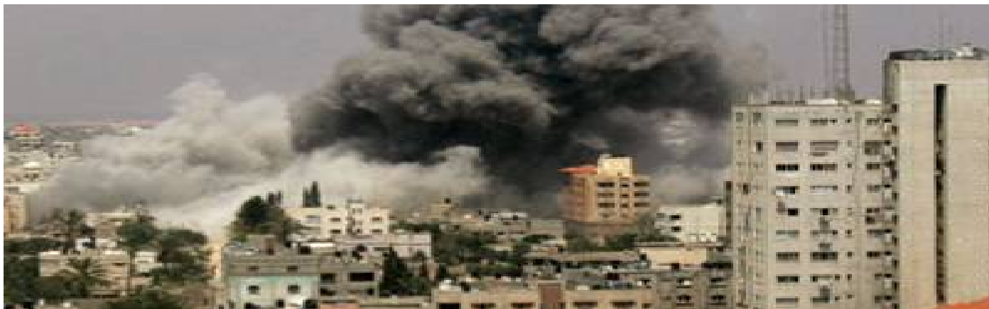
Gaza sotto attacco

Analizzando le cifre delle “perdite collaterali” di questi episodi, che qui vengono portati come esempi dei conflitti moderni che sembrano schierare i civili in prima linea, rispetto ai vantaggi o alle necessità che li hanno scaturiti, ci si domanda quale metro di misura venga utilizzato per la valutazione dell’“adeguata proporzionalità”.