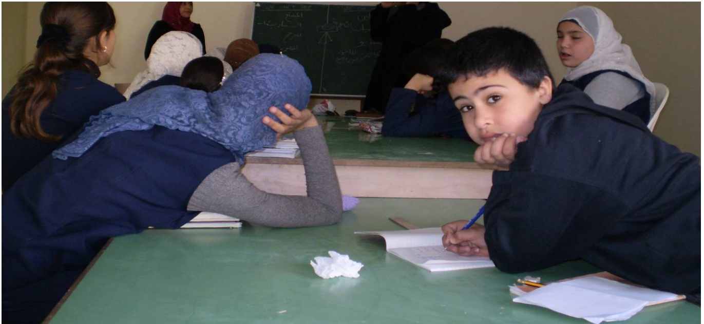
Classe di Nahr el Bared

Ci auguriamo che tutte le istituzioni in materia di diritti umani di aiutino a far rispettare i nostri diritti e la libertà di vivere in condizioni migliori di questa vita che viviamo adesso, dopo la guerra.